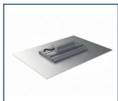
Кронштейн АЗС Unit D90, 590x410 (комплект)